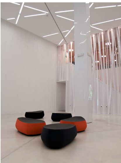
Patio central.

El edificio era una sucursal bancaria en plantas sótano, baja y primera, con los despachos de la Presidencia de la compañía en la segunda planta. Los fines tan específicos del inmueble y el carácter segregado de sus espacios constitutivos fueron la principal preocupación para plantear un sistema de referencias espacial y circulatorio que conectara los diversos espacios que albergan a las diferentes empresas.