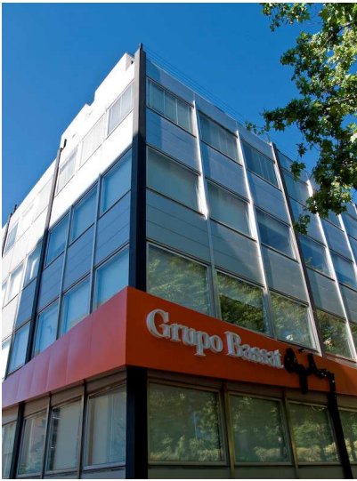
Oficinas de Bassat & Ogilvy en un céntrico edificio de la calle Maria de Molina. Foto: Wilkhahn